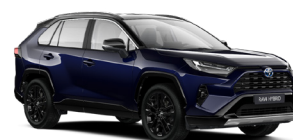
2RA Темно-синій, металік з чорним дахом 3