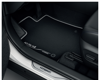
Килимки салону, текстильні