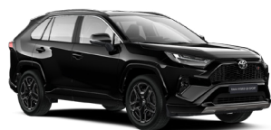
218 Чорний, металік 5