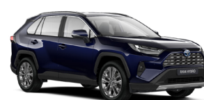
8Х8 Темно-синій, металік 2