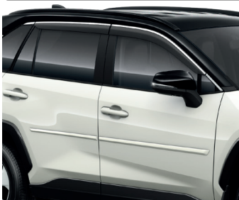
Молдинги дверей, Дефлектор вікон, Хромована накладка дверей багажного відділення