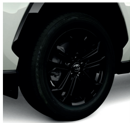
Колісні диски 17"