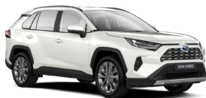
089 Білий, перламутр 2