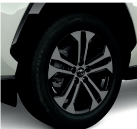
Колісні диски 18"