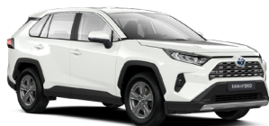
040 Білий, лак 1