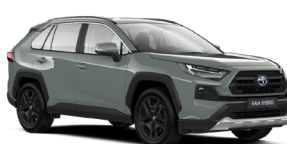
6Х3 Хакі, лак 2