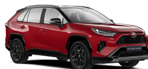
2SC Червоний, перламутр з чорним дахом 4