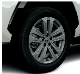
Колісні диски 18"