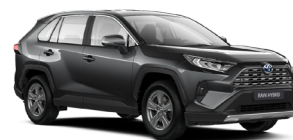
1G3 Сірий, металік 2