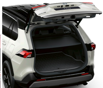
Килимок багажника, гумовий