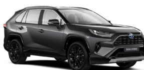
2QZ Сірий, металік з чорним дахом 3