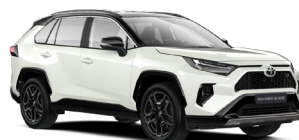
2PS Білий, перламутр з чорним дахом 3