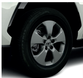
Колісні диски 17"