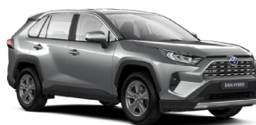
1D6 Сріблястий, металік 2