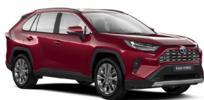
3ТЗ Червоний, перламутр 2