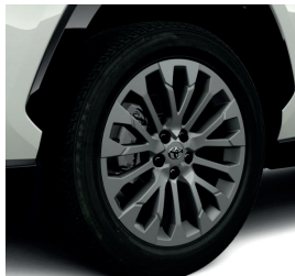
Колісні диски 19"