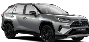
2QY Сріблястий, металік з чорним дахом 3