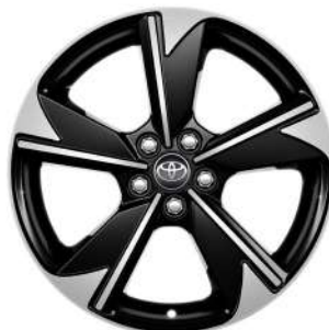
Легкосплавні диски 15", чорні