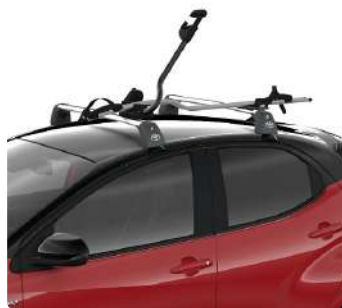
Поперечини даху, кріплення для велосипеда