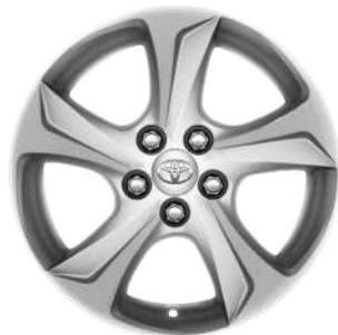
Легкосплавні диски 15"