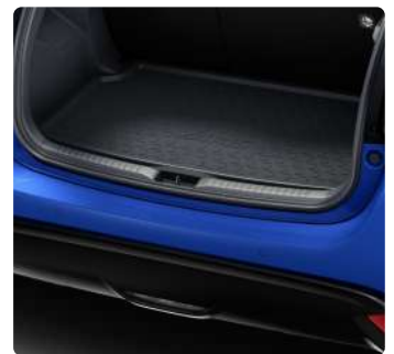
Килимки салону, гумові, Килимок багажника, гумовий