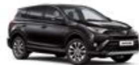
209 Чорний 2