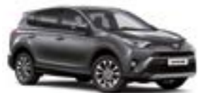
1G3 Сірий 2