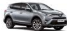
1F7 Сріблястий 2