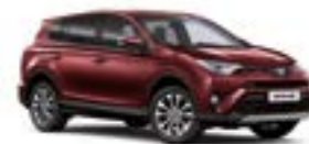
3T0 Темно-червоний 2