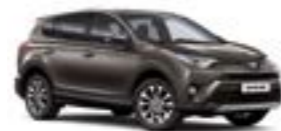
4U5 Темно-коричневий 2

Вся інформація, представлена у цьому матеріалі, є точною та дійсною станом на дату публікації 19.10.2016. Імпортер автомобілів Toyota залишає за собою право вносити зміни до інформації, наведеної в цьому матеріалі, без попереднього повідомлення.