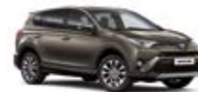
4T3 Бронзовий 2