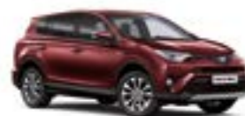
3T0 Темно-червоний 5