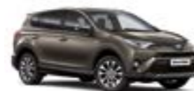
4T3 Бронзовий 5