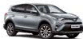
1D6 Сріблястий 5