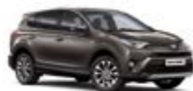
4U5 Темно-коричневий 5

Вся інформація, представлена у цьому матеріалі, є точною та дійсною станом на дату публікації 27.02.2017. Імпортер автомобілів Toyota залишає за собою право вносити зміни до інформації, наведеної в цьому матеріалі, без попереднього повідомлення.