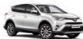
070 Білий перламутр 5