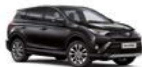
209 Чорний 5